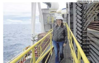
►► Alegret participó en la investigación sobre Zelanda en el 2017.