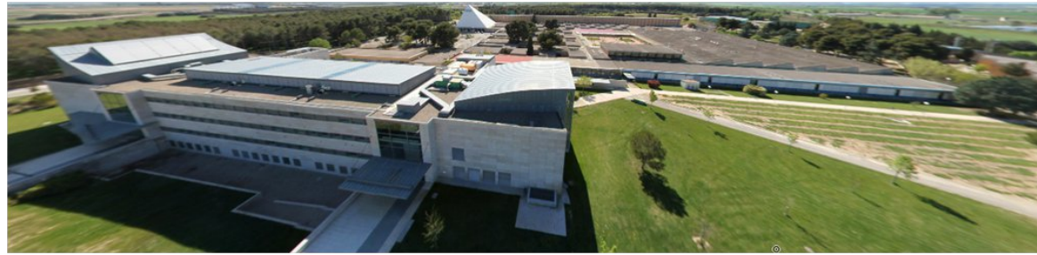
Boletín de la Escuela Politécnica Superior de Huesca

Escuela Politécnica Superior - Huesca Universidad Zaragoza